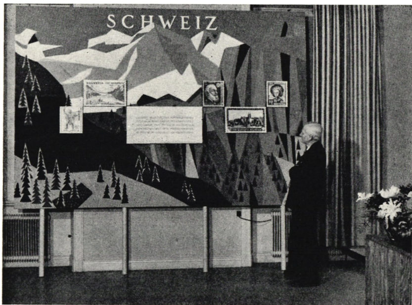
3. Från schweiziska frimärksutställningen i postmuseum.

Tidningen Folket i Bilds Frimärksklubb celebrerade sin 10-åriga tillvaro genom att i postmuseum, i samarbete med museet, under tiden 26 oktober—4 november anordna en frimärksutställning, "Frimärket ger". Det var den första internationella utställningen för s. k. motiv-