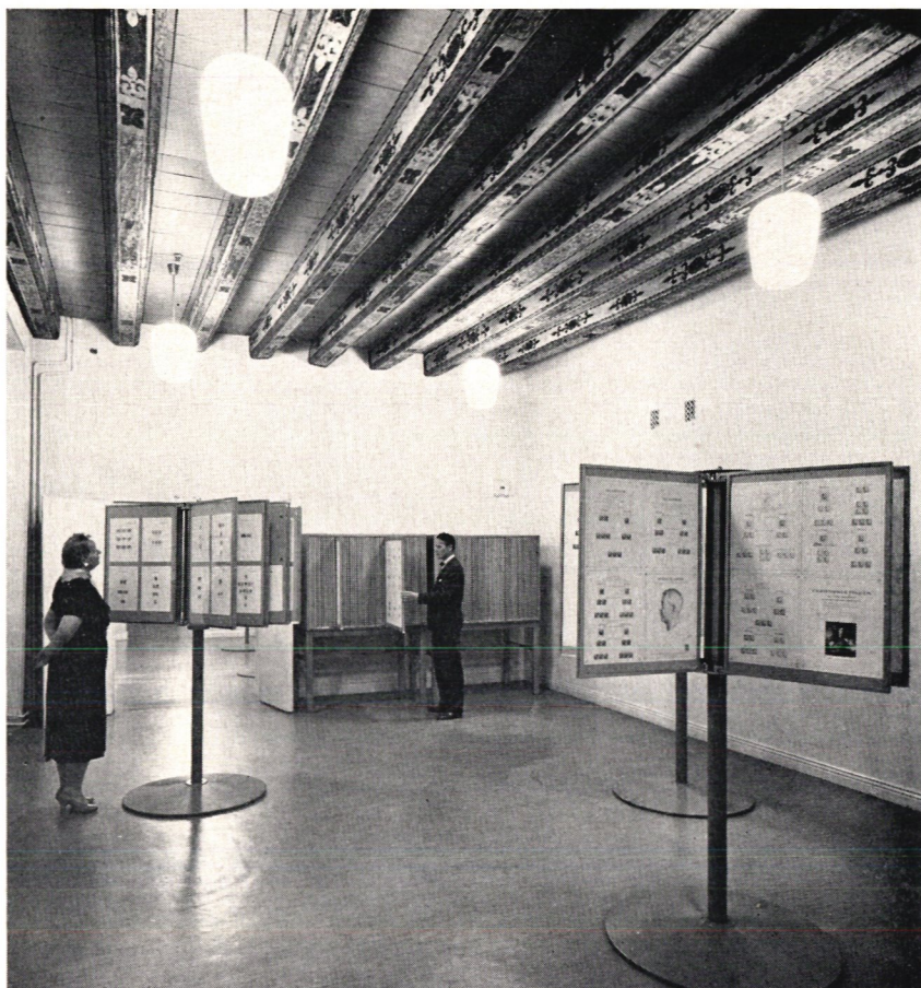
Bild 4. Nordenrummet i Postmuseum. Bjälkarna i taket datera sig från mitten av 1600-talet.

ram har plats för 18 albumblad. De två montrerna rymmer sålunda hela 1 800 albumblad. Hur inredningen i rummet för övrigt i detalj skall utformas är ännu i skrivande stund — juli 1959 — inte helt klart. Så mycket är dock säkert som att allt kommer att göras för att ge de förnämliga samlingarna en ram som är dem värdig.