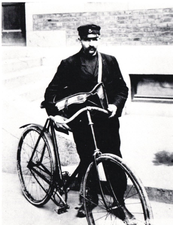
Cykel av 1906 års modell.

På våren 1898 var det en 35-årig postman på Reselaget Krylbo-Storvik, vilken troligen under sin 12–15 år långa postmannabana inte åtnjutit en enda dags ledighet, ingav till postinspektionen i Mellersta distriktet ansökan om ledighet av följande lydelse: »Anhålles vördsamt om kostnadsfri ledighet bönsöndagen den . . . för att tillsammans med min familj få begå herrrens heliga nattvard». Någon ledighet blev det inte. I stället för nattvardsgång blev det en allvarlig erinran för olämpligt skrivsätt. Annars var religiösa skäl de enda som möjligen kunde vinna gehör vid denna tid.