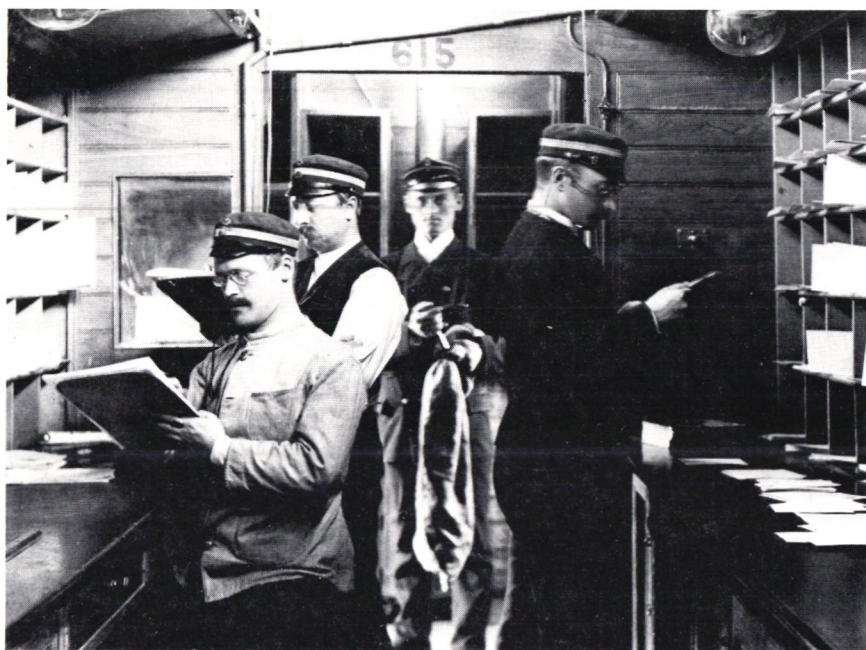
Arbetslag i postkupé.

ringarna. Postkupépersonalen från Stockholm och Malmö hade överliggningsort bli i Nässjö och var här på jakt efter något ätbart. Lagpostiljonen för 62:an hade vid ett sådant tillfälle lyckats få tag i en tupp av en lantman från trakten. Postkupé 62, som gick i nattställtåget, kallades i dagligt tal för 62:an. Det var lagpostiljonen som hade hand om utväxlingen av post vid stationerna, ett nog så ansvarfullt arbete. På honom ankom att posten kom rätt.