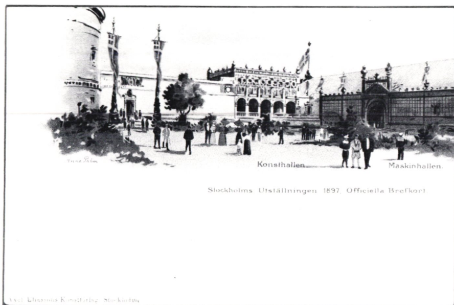
Vykort från Stockholmsutställningen 1897.

Vykorten eller vybrevkorten som de från början kallades torde ha kommit till i samband med 1897 års stockholmsutställning.