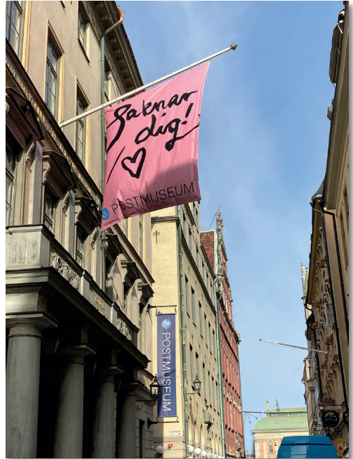
Utställningen Saknar dig! annonserades med flaggor och affischer i gatubilden.