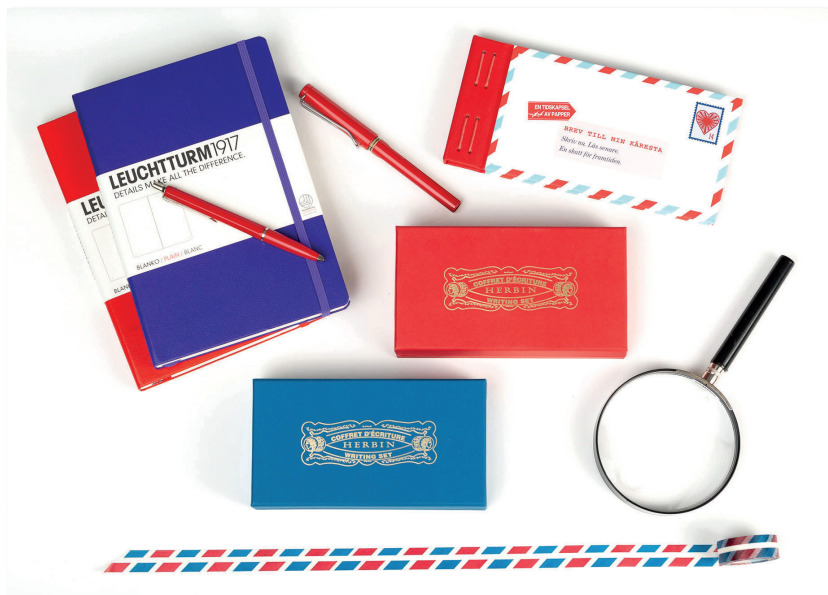
Webbshop.