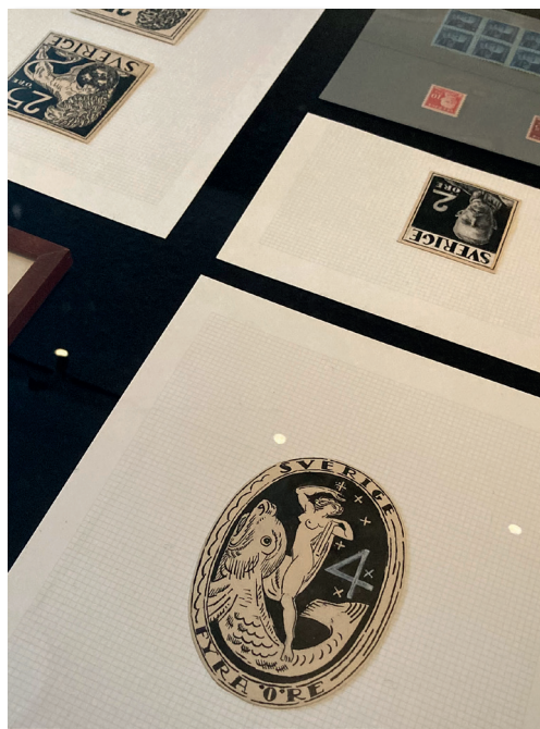
Törnemans frimärken på Thielska.