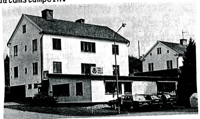
Edsbruks postkontor

Till posten i Edsbruk har två postombud varit knutna under en övergångsperiod efter indragning av poststationer i dess närhet. Postombudet som ersatte poststationen i Vråka den 1 november 1955 och avvecklades den 30 september 1963 hade gravyren EDSBRUK POB 1 i sin datumstämpel. Ett motsvarande postombud fanns i Skedshult under tiden 1 november 1956 - 31 mars 1969 med gravyren EDSBRUK POB 2 i datumstämpeln.