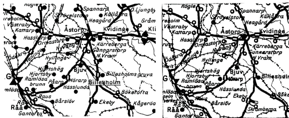
1939 års postkarta (till vänster) skiljer sig från 1948 års (till höger) i vissa avseenden, på grund av tillkomsten av poststationen i Skromberga och nedläggning av bandelen Bjuv-Billesholm.

Sammanläggningen vållade inte några problem för befolkningen och poststationen, som med ny terminologi kallades postkontor från 1977, utvecklades positivt. Ulla Ebelin Kristensson tog så småningom över den med ansvar för service till närmare 1 500 hushåll.