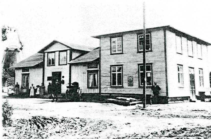
Poststationen i Gökhem 1898

Åtskilliga poststationer som inrättades under 1880- och 1890-talen, kom till mot villkor att kommunen skulle avlöna poststationsföreståndaren under de första åren. Ett sådant exempel är den västgötska poststationen i Gökhem. Vid en extra kommunalstämma i Gökhems folkskola den 17 november 1890 protokollfördes, att Gökhems kommun förband sig att avlöna poststationsföreståndaren under en tid av högst tre år. Poststationen kom därefter till stånd den 1 mars 1891.