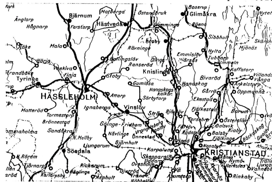
Utdrag ur 1948 års kommunikationskarta.

Poststationen skildes från järnvägen den 15 juni 1969 och ny föreståndare blev enligt avtal i september 1970 Rut Valborg Nilsson. Hon fick uppleva poststationens namnändring till Kristianstad 11 den 1 maj 1970 och dess statushöjning till postexpedition den 1 oktober 1973. Med ändrad terminologi blev postexpeditionen lokalpostkontor 1977 och postkontor 1986, nu med adress Wrangels Allé 62 i Kristianstad. Adressnamnet Färlöv återinfördes den 1 april 1992.