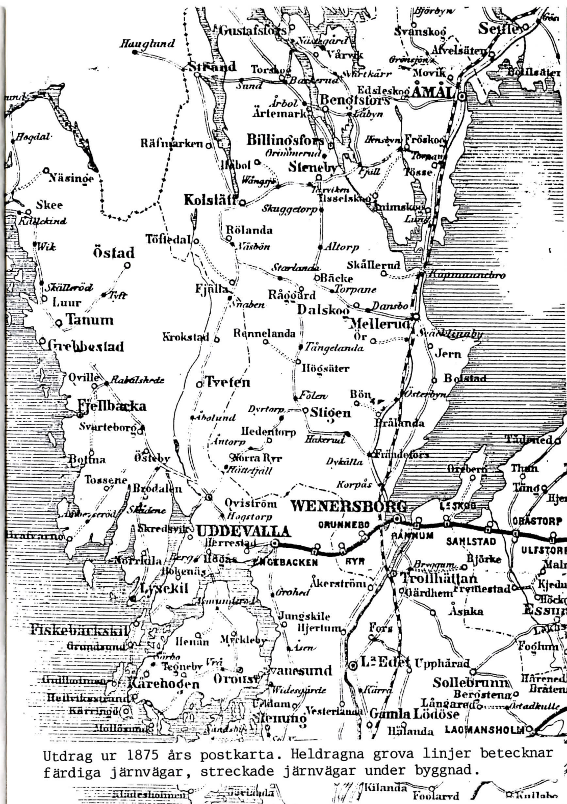
Utdrag ur 1875 års postkarta. Heldragna grova linjer betecknar färdiga järnvägar, streckade järnvägar under byggnad.