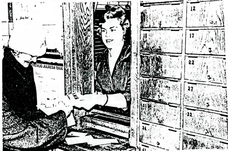
På papperet ansvarar stationsföreståndarna för postservicen. Denna fullgjordes emellertid ofta av postbiträden, anställda av SJ. Detta foto togs vid postluckan i Stidsvig i december 1966 av Arvid Bengtsson, Stidsvig. Stationshuset revs i december 1971.

Indragningen av poststationen den 12 maj 1968 samordnades med nedläggning av persontrafiken på järnvägen Värnamo-Åstorp. Postens kunder i Stidsvig fick service genom lantbrevbäring från Klippan.