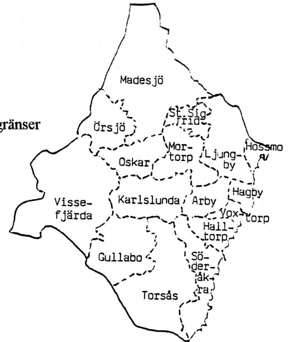
Södra Møre härads sockengräns