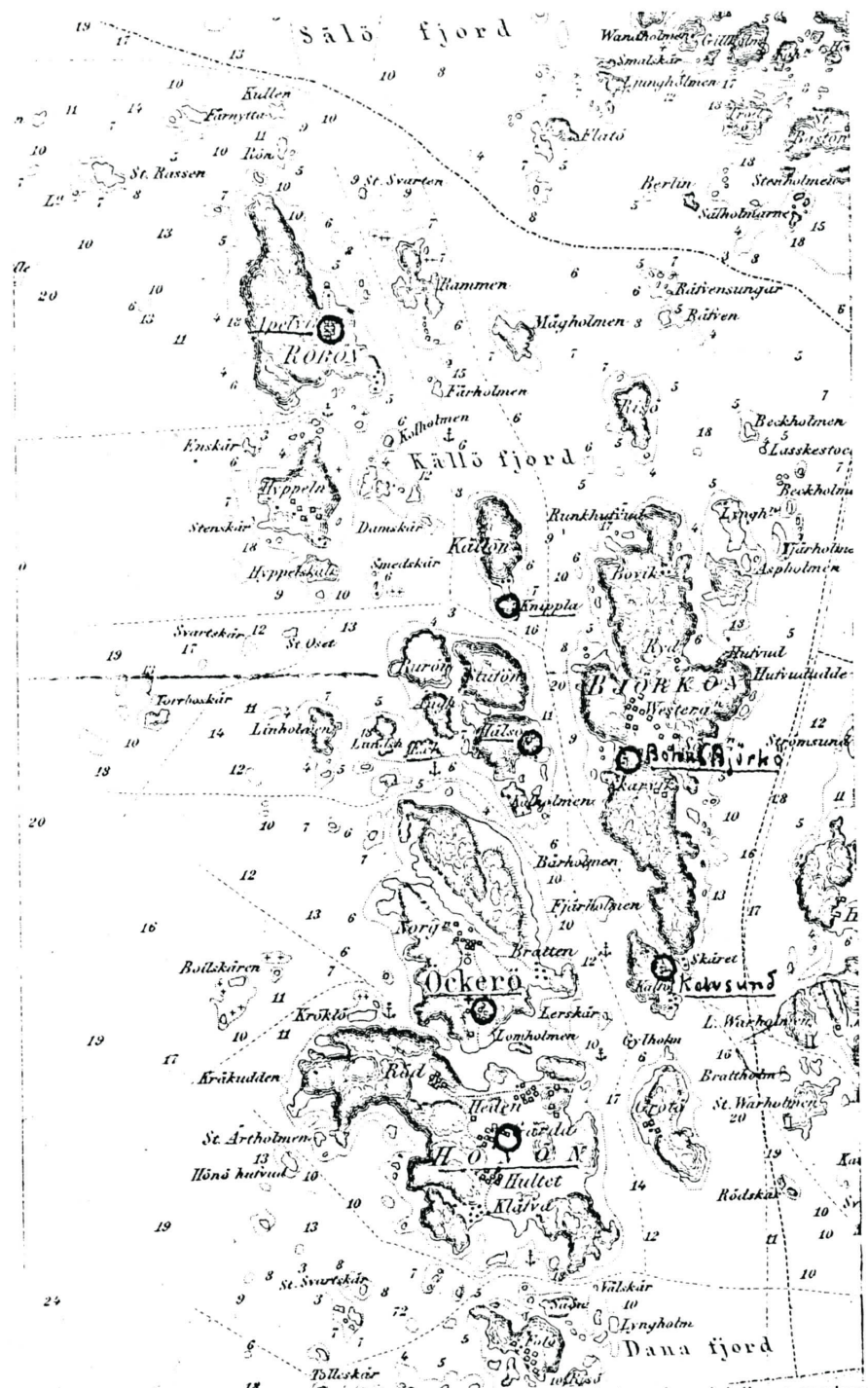
Detta urklipp ur generalstabskartan visar Göteborgs norra skärgård med poststationer markerade omkring år 1920, alltså lång tid efter röröbornas framställning om en egen poststation.