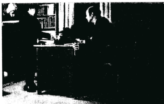
Ett vanligt skrivbord utgör ofta postdisk. Artikelförfattaren på sin poststation.

Nu händer kanske, att en kund får ett utbetalningskort på 250 kr och ett postförskott på 19:50. Han gör sig inte brått med att hämta någotdera utan blir påmind. Postförskottet går