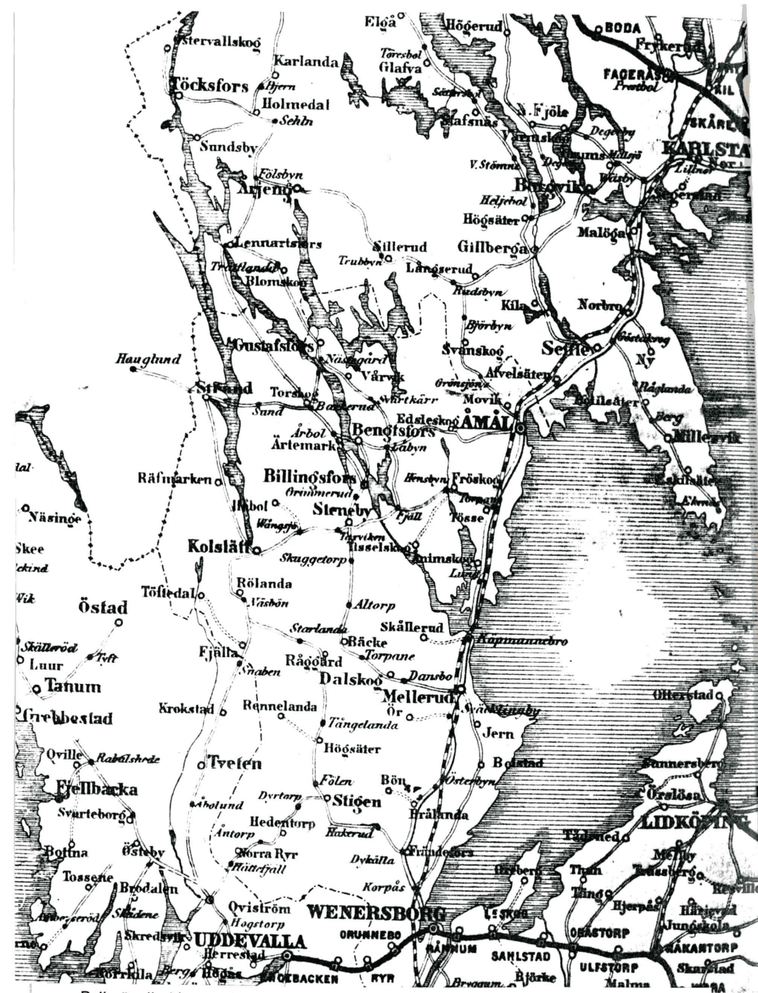
Detta är ett utdrag ur den post- och järnvägskarta som tillämpades under perioden 1875-1878. Kraftiga heldragna linjer markerar färdiga järnvägar, medan järnvägar under byggnad återges med streck.