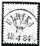
1872-01-01--1979-05-31 Därefter postställe Rimfors-Ulrika Post-i-butik 1992