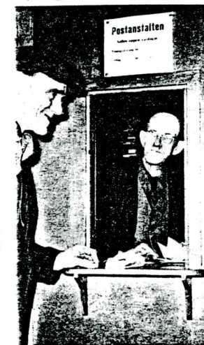
I nr 6/1955 av personaltidskriften PS publicerades denna bild från poststationen i Lotorp.

Postexpeditionen genomgick de förändringar som följde på 1970-talets rivande utveckling, kallades lokalpostkontor och från 1986 enbart postkontor för att efter projekt "Nät 92" lämnas på entreprenad och bli "Post-i-butik" i Konsum. Postmästaren i Finspång har det övergripande ansvaret för postservicen där.