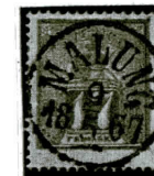
1852-01-01-- Stavat Malugn under drygt 13 inledande år

Denna kungörelse i poststyrelsens cirkulär informerade om de nya järnvägsstationerna.