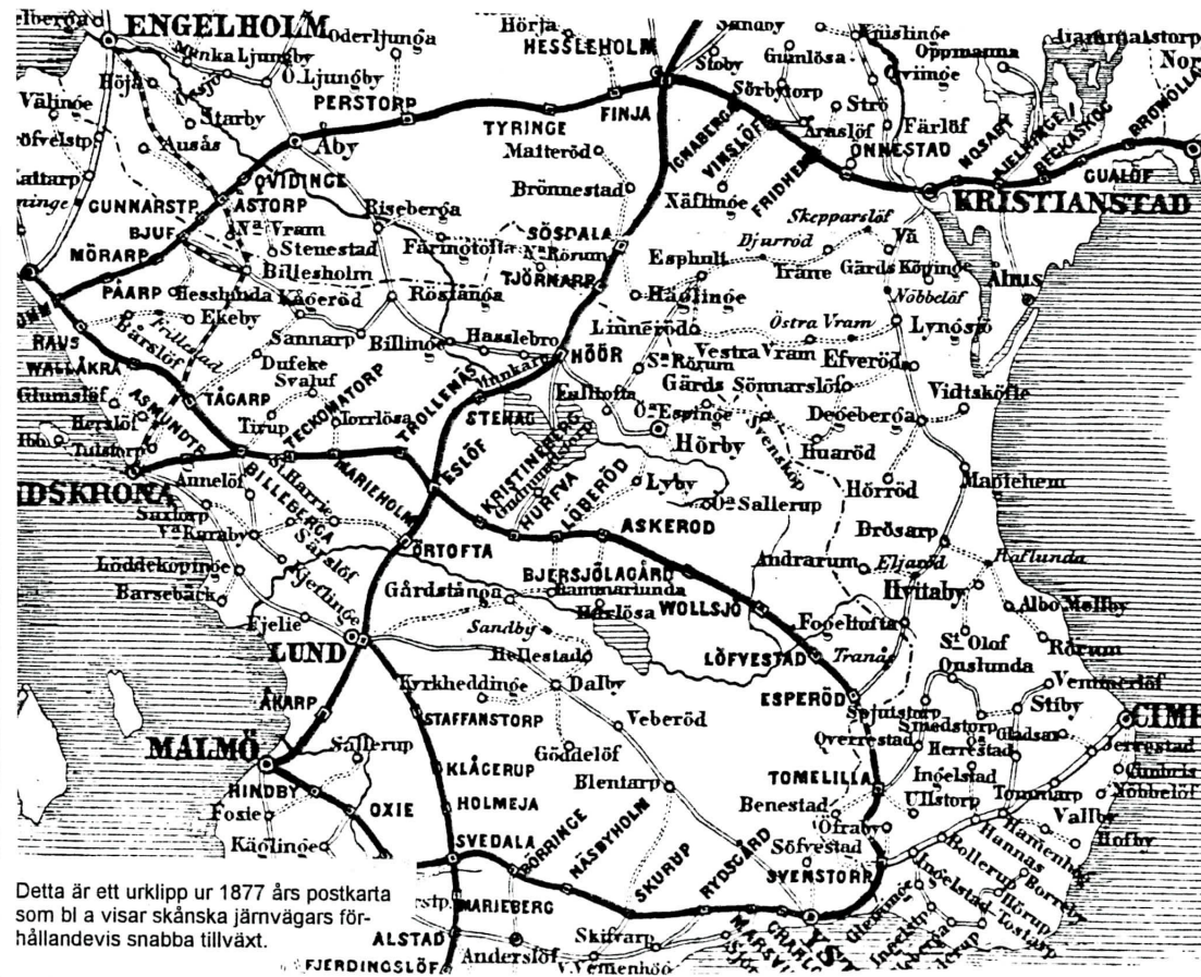
Detta är ett urklipp ur 1877 års postkarta som bl a visar skånska järnvägars förhållandevis snabba tillväxt.

Starten för postbefordran på delsträckan Helsingborg-Klippan "drunknade" mer eller mindre i raderna om fullbordandet den 23 november 1874 av den slutgiltiga sträckningen för Södra Stambanan som den blev efter att sedan 1864 ha varit sträckt över Falköping-Nässjö.