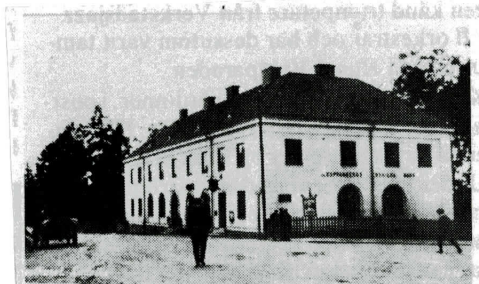
Posthuset i Ludvika byggdes år 1921 och såg då ut så här.

Under hela invigningsdagen strömmade gratulationer in från affärerna i centrum och bankerna på orten. De såg verkligen till att kassaexpeditionen blev blomstersmyckad.