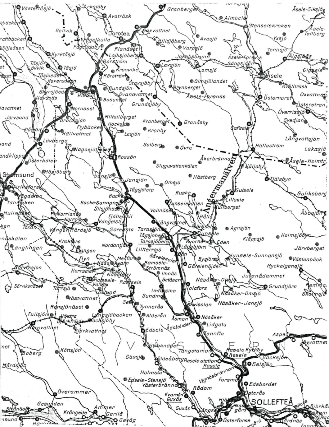
Delta utdrag ur 1939 års post-, tele- och järnvägskarta visar sträckningen av den år 1925 öppnade järnvägen mellan Hoting och Långsele inklusive senare tillkomna poststationer.

Inlandsbanans tillkomst medförde indragning av postlinjen mellan Hoting och Dorotea, vilken utgick från postlinjen mellan Backe och Alanäset. Hoting blev järnvägsknutpunkt genom att statsbanan från Forsmo, den vi nu skall ge oss i väg på under en låtsasfärd, uppläts för allmän trafik den 3 december 1925.