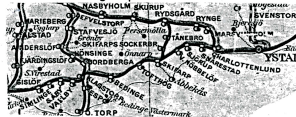
Urklipp ur 1904 års post-, tele- och järnvägskarta

Copyright Erik Lindgren Förlagan tillverkad 1999