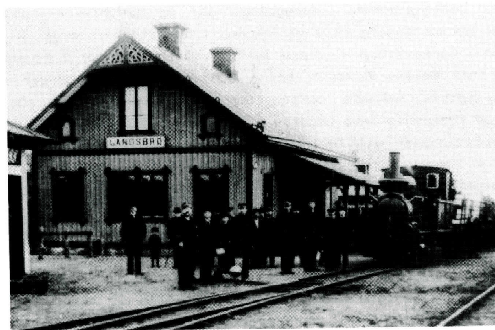
Landsbro järnvägsstation omkring sekelskiftet.

Men major Nordenskjöld skrev förgäves. Ett par andra namnförslag kom fram och när järnvägsbolagets slutyttrande skrevs under i september 1894, framhölls att järnvägen inte hade något att anmärka mot något av de föreslagna namnen Landsbro, Trishult eller Rosenholm, "men i fall ett förord bör givas, lämnas detta åt namnet Landsbro".