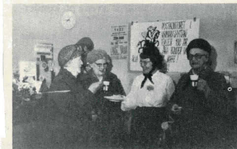
Vidstående bild är hämtad från personaltidningen PS i jan 1981.

Det följande decenniet medförde genomträngande omorganisering över hela landet. Kostnaderna blev för höga och postverket lämnade sina postkontor på entreprenad i allt högre takt. I Vikmanshyttan blev det GK Livs ICA som fick träffa avtal om en s k post-i-butik.