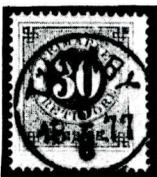
Tuna 1874-01-01--1875-12-31 Tunaby 1876-01-01--1879-03-31